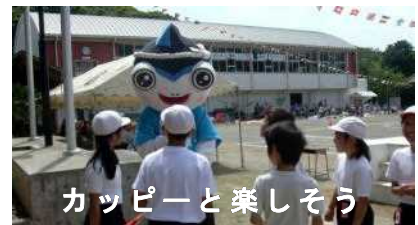
カッピーと楽しそう