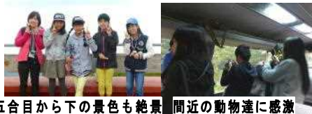
五合目から下の景色も絶景 周辺の動物達に感激