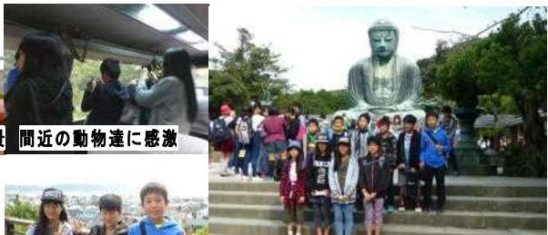
大仏様が、みんなの幸せを 祈ってくれているようです