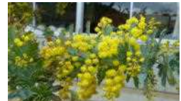
職員室前のミモザの花 (花言葉：友情、思いやり)

勝浦市立郁文小学校 平成29年3月13日発行 第20号 住所：勝浦市松部1000-1 ☎73-0246 ホームページ http://ikubun.sakura.ne.jp