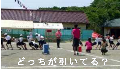
どっちが引いてる？