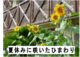
夏休みに咲いたひまわり

2学期は、学校行事やPTA活動、地域の行事、ミニバス大会やサッカー大会など、たくさんの活動を控えています。一つ一つの活動を「楽しく、真剣に」取り組むことで、実り多い2学期が送れると思います。保護者の皆様や地域の皆様の変なご支援、ご協力をよろしくお願いいたします。