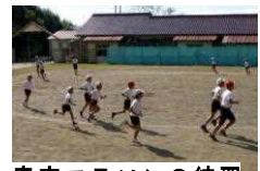
青空マラソンの練習

勝浦市立郁文小学校 平成28年11月14日発行 第13号 住所：勝浦市松部1000-1 ☎73-0246 ホームページ http://ikubun.sakura.ne.jp