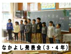
なかよし発表会(3・4年)