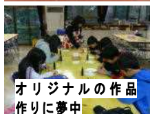
オリジナルの作品 作りに夢中