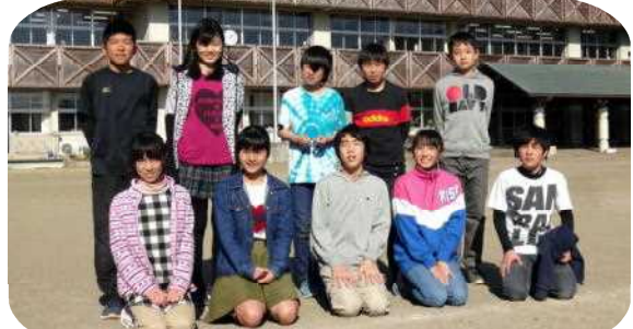
明るく、やさしい、郁文小学校の10人の卒業生

【平成29年3月16日(木) 10時開式】 (保護者受付け9時) 記念写真撮影があります。 校庭で行われるので、お天気に合わせてお越しください。 卒業生は、卒業式当日、卒業証書授与式に出席し、卒業証書を受け取ります。 卒業生は、卒業式当日、卒業証書授与式に出席し、卒業証書を受け取ります。 卒業生は、卒業式当日、卒業証書授与式に出席し、卒業証書を受け取ります。