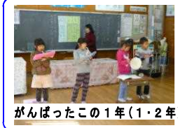
がんばったこの1年(1・2年)

今年度最後の「授業参観」と「学級懇談会」を行いました。各教室では、1年の授業の様子や、保護者の皆様への説明を行いました。また、郁文会役員改選も行いました。