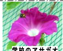
学校のアサガオとハチ(左上)

勝浦市立郁文小学校平成28年9月13日発行第9号 住所：勝浦市松部1000-1 電話73-0246 ホームページ http://ikubun.sakura.ne.jp