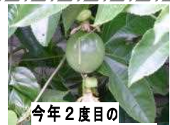
今年2度目の パッションフルーツ

勝浦市立郁文小学校 平成28年10月17日発行第11号 住所：勝浦市松部1000-1 番73-0246 ホームページ http://ikubun.sakura.ne.jp