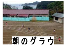
朝のグラウンドと海

勝浦市立郁文小学校 平成28年10月5日発行 第10号 住所：勝浦市松部1000-1 電話：73-0246 ホームページ http://ikubun.sakura.ne.jp