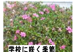
学校に咲く季節 外れのサツキの花

勝浦市立郁文小学校 平成28年12月14日発行 第15号 住所：勝浦市松部1000-1 ☎73-0246 ホームページ http://ikubun.sakura.ne.jp