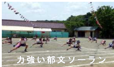
力強い郁文ソーラン