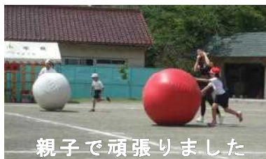
親子で頑張りました