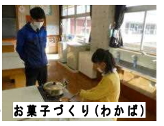
お菓子づくり(わかば)