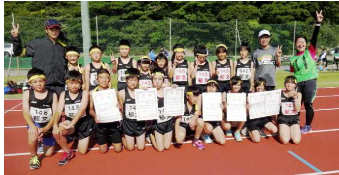
賞状を7枚獲得！「チーム郁文」頑張りました