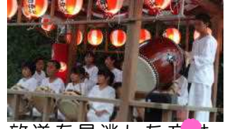
放送を見逃した方は、