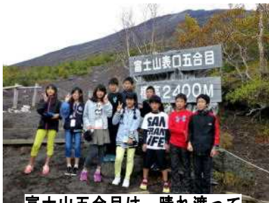
富士山五合目は、晴れ渡っていました

10人の子どもたちは、早朝の郁文小を後にして、1日目最初の目的地、富士山五合目に向かいました。10℃以下の気温で寒かったです。標高2400mの五合目に上れば、木は育たない岩肌が遠くまで見え、感動していました。河口湖フィアードには、クワガタやクマノミなど、オリジナルの作品づくりを楽しみました。2日目は、秋の空も青々として、鎌倉市内散策ができました。大仏(高徳院)を見学後、3班に分かれ、江ノ電に乗り、鶴岡八幡宮を見学したり、小町通りの雰囲気を楽しみながら、1泊2日の旅でした。