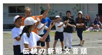
伝統の新郁文音頭