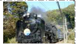
松部武内神社奥の線路付近から撮影したSL(1/22)

勝浦市立郁文小学校 平成29年2月13日発行 第18号 住所：勝浦市松部1000-1 ☎73-0246 ホームページ http://ikubun.sakura.ne.jp