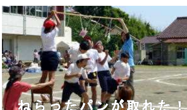
ねらったパンが取れた！