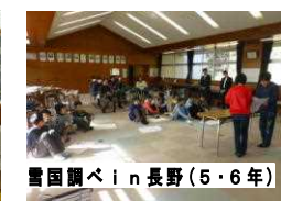
雪国調べin長野(5・6年)