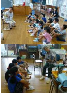
全国や県の平均を上回りました。

9月2日(金)に、第2回「ひなたが丘の会」読み聞かせ会を開催しました。2学期の「読み聞かせ」は、12月まで毎月2回開催します。読み聞かせは、子ども達の読書好きを育て、読書習慣を身につけてもらうための大切な活動です。今年度も、毎月2回開催します。