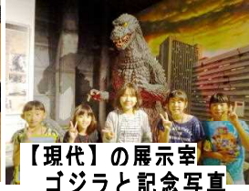
【現代】の展示室 ゴジラと記念写真

5年生と6年生の9人全員が参加して、社会科見学で佐倉市にある「国立歴史民俗博物館」に行きました。日本史や古学や歴史、民族についてさまざまな体験も学校で勉強していることをさらに詳しく知ることができました。5年生と6年生の9人全員が参加して、社会科見学で佐倉市にある「国立歴史民俗博物館」に行きました。日本史や古学や歴史、民族についてさまざまな体験も学校で勉強していることをさらに詳しく知ることができました。