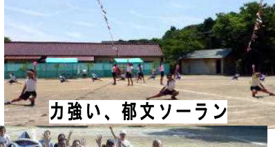
力強い、郁文ソーラン