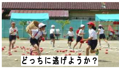
どっちに逃げようか?