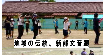
地域の伝統、新郁文音頭