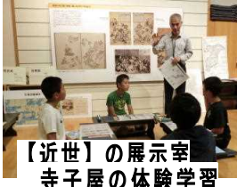
【近世】の展示室 寺子屋の体験学習