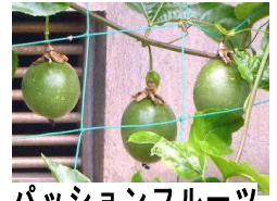
パッションフルーツ

勝浦市立郁文小学校 平成29年7月13日発行 第7号 住所：勝浦市松部1000-1 ☎73-0246 ホームページ http://ikubun.sakura.ne.jp