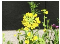
“春”到来 学校の菜の花

勝浦市立郁文小学校 平成30年3月12日発行 第20号 住所：勝浦市松部1000-1 ☎73-0246 ホームページ http://ikubun.sakura.ne.jp