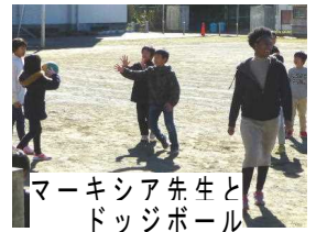
マーキシア先生と ドッジボール