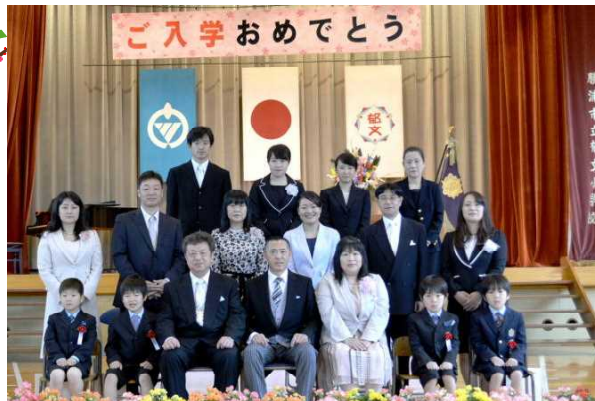
ご入学おめでとう