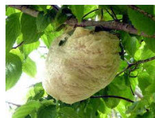
モリアオガエルの卵

勝浦市立郁文小学校 平成29年5月17日発行 第3号 住所：勝浦市松部1000-1 ☎73-0246 ホームページ http://ikubun.sakura.ne.jp