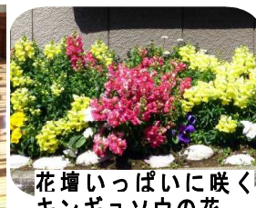
花壇いっぱい咲くキンギョソウの花