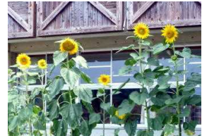
夏休みに咲いたひまわり

42日間の夏休みが終わり、郁文小学校に活気が戻ってきました。子ども達は、保護者や地域の皆様に見守られながら、さまざまな体験をして有意義に過ごすごとができ、全員元気に始業式を迎えることができました。今年夏の8月半ば過ぎまで夏らしくない天気が続きましたが、後半になってようやく真夏の日差しが戻ってきました。夏休み中、スポーツの世界では、サッカー、陸上競技、水泳、レスリング、バドミントン、卓球、女子ソフトボール、柔道など多くの種目で日本人選手の活躍が見られ、明るい話題を届けてくれました。 2学期は、祭礼などの地域の行事やPTA活動、ミニバス大会やサッカー大会、総合学習発表会などたくさんの行事を控えています。一つ一つの活動を、「もっとできる」という思いで「明るく、楽しく、真剣に」取り組むことで、実り多き2学期になることと思います。今学期も保護者や地域の皆様の変化にぬく支援、ご協力をよろしくお願いいたします。