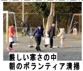
厳しい寒さの中 朝のボランティア清掃

勝浦市立郁文小学校 平成30年1月29日発行 第17号 住所：勝浦市松部1000-1 ☎73-0246 ホームページ http://ikubun.sakura.ne.jp