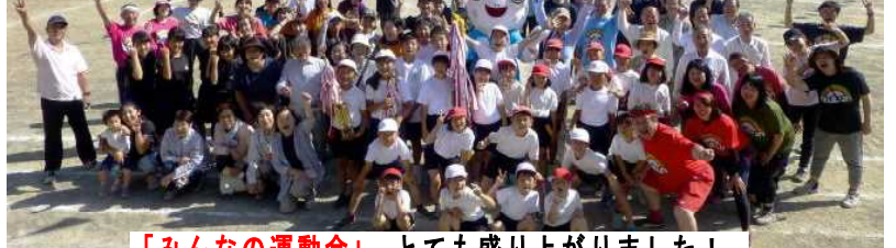
「みんなの運動会」とても盛り上がりました!