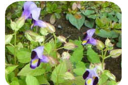
花壇に咲くトレニア

勝浦市立郁文小学校 平成29年9月13日発行 第9号 住所：勝浦市松部1000-1 ☎73-0246 ホームページ http://ikubun.sakura.ne.jp