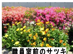
職員室前のサツキとキンセンカ

勝浦市立郁文小学校 平成29年4月25日発行 第2号 住所：勝浦市松部1000-1 ☎73-0246 ホームページ http://ikubun.sakura.ne.jp