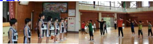
男子の皆さんも、気持ちのこも

5日(金)に行われた1地区ミニバス大会に トボい前、少来元 ッ会夏一合っ の蒸し暑さの中、 育の館の蒸し暑さ の練習の意が伝わ 決意が伝わってき 来迎で、力づけられ 元氣な応援