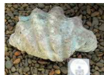
旧校舎の時からある 巨大なシャコ貝

勝浦市立郁文小学校 平成30年12月3日発行 第14号 住所：勝浦市松部1000-1 ☎73-0246 ホームページ http://ikubun.sakura.ne.jp