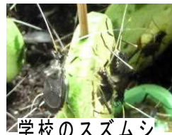
学校のスムージー

勝浦市立郁文小学校 平成30年9月3日発行 第8号 住所：勝浦市松部1000-1 ☎73-0246 ホームページ http://ikubun.sakura.ne.jp