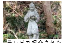
テレビで紹介された 二宮金次郎像

勝浦市立郁文小学校 平成30年12月17日発行 第15号 住所：勝浦市松部1000-1 ☎73-0246 ホームページ http://ikubun.sakura.ne.jp