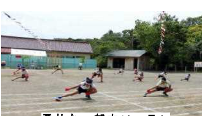
勇壮な、郁文ソーラン