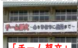
「チーム郁文」 の横断幕

勝浦市立郁文小学校 平成30年5月25日発行第4号 住所：勝浦市松部1000-1 ☎73-0246 ホームページ http://ikubun.sakura.ne.jp