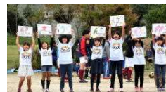
サッカー大会 女子の応援

勝浦市立郁文小学校 平成30年10月29日発行 第12号 住所：勝浦市松部1000-1 ☎73-0246 ホームページ http://ikubun.sakura.ne.jp