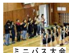
ミニバス大会 保護者に挨拶

勝浦市立郁文小学校 平成30年10月15日発行 第11号 住所：勝浦市松部1000-1 ☎73-0246 ホームページ http://ikubun.sakura.ne.jp