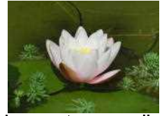
池のスイレンの花

勝浦市立郁文小学校 平成30年5月15日発行 第3号 住所：勝浦市松部1000-1 ☎73-0246 ホームページ http://ikubun.sakura.ne.jp