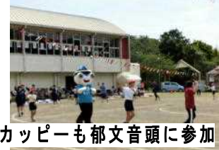
カッピーも郁文音頭に参加