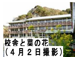
校舎と菜の花 (4月2日撮影)

勝浦市立郁文小学校 平成30年4月9日発行 第1号 住所：勝浦市松部1000-1 ☎73-0246 ホームページ http://ikubun.sakura.ne.jp