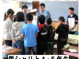
銀シャリと4・5年生

勝浦市立郁文小学校 平成31年1月28日発行 第17号 住所：勝浦市松部1000-1 ☎73-0246 ホームページ http://ikubun.sakura.ne.jp