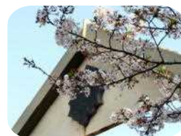
正門の桜 (4月2日撮影)