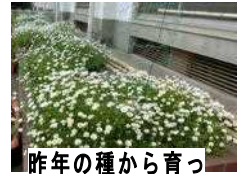
昨年の種から育ったノースポール

勝浦市立郁文小学校 平成30年4月26日発行 第2号 住所：勝浦市松部1000-1 ☎73-0246 ホームページ http://ikubun.sakura.ne.jp