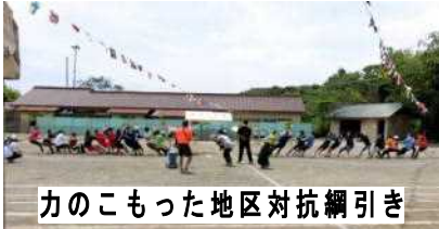
力のこもった地区対抗綱引き