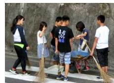
朝のボランティア

勝浦市立郁文小学校 平成30年6月11日発行 第5号 住所：勝浦市松部1000-1 ☎73-0246 ホームページ http://ikubun.sakura.ne.jp