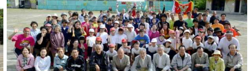
最後の「みんなの運動会」心をひとつに全員集合!